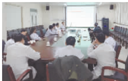
急性脑梗死血管内治疗多学科协作与急诊绿色通道启动会