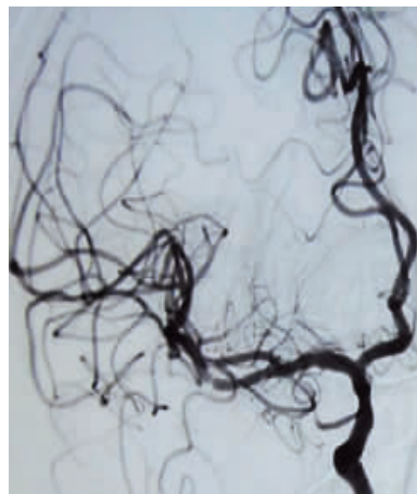
大脑中动脉闭塞取栓后